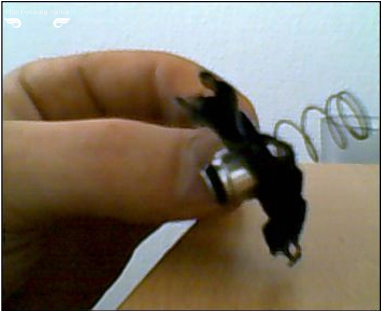
Tuto réalisé par Dendron